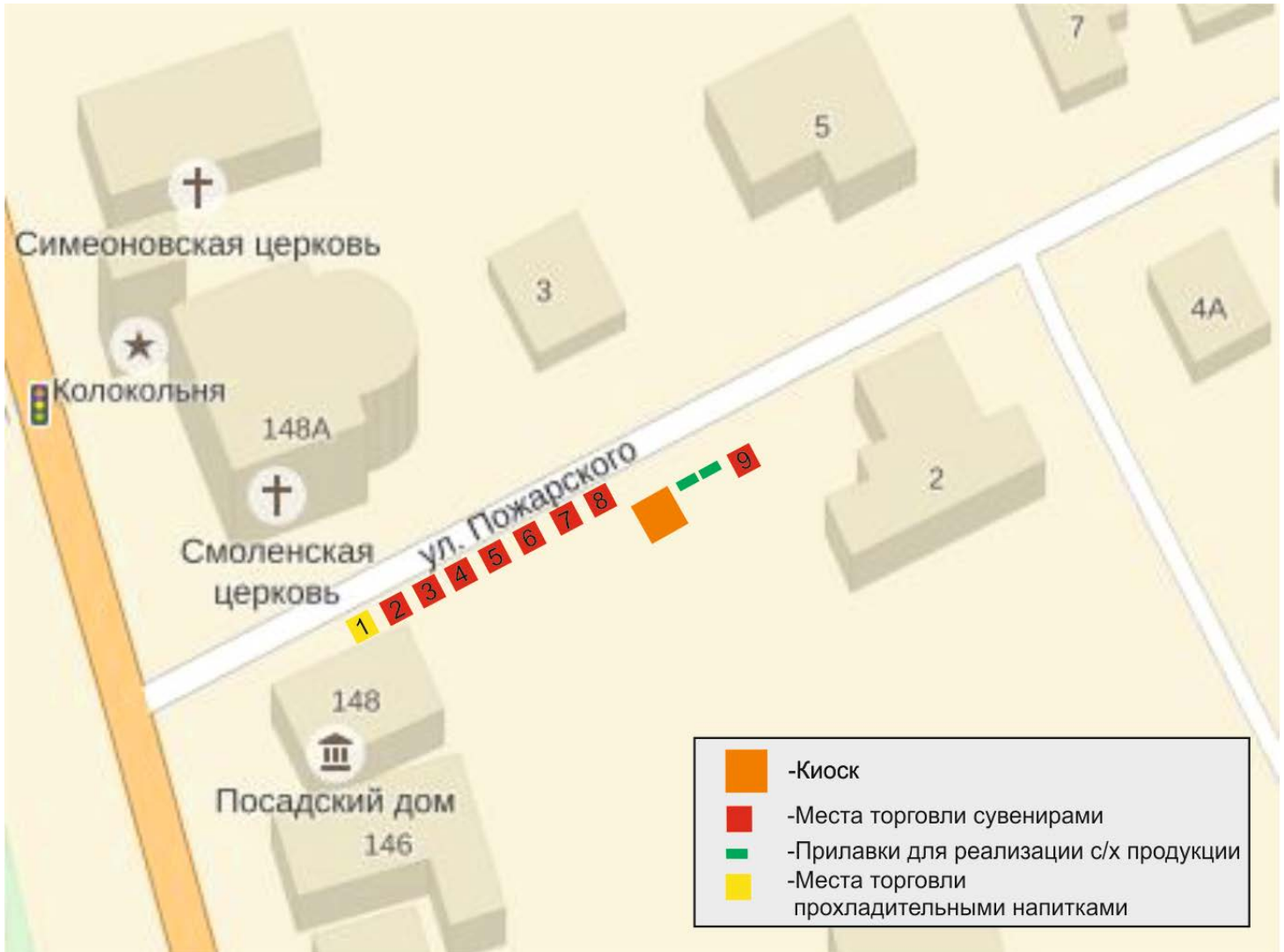
СХЕМА размещения торговых мест на универсальной ярмарке на территории города Суздаля